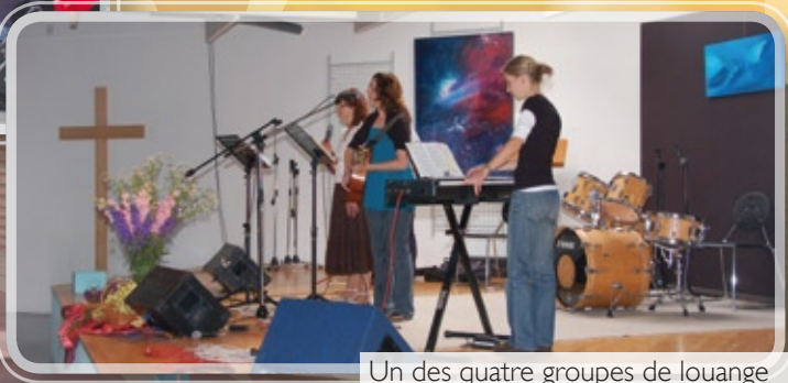
Un des quatre groupes de louange