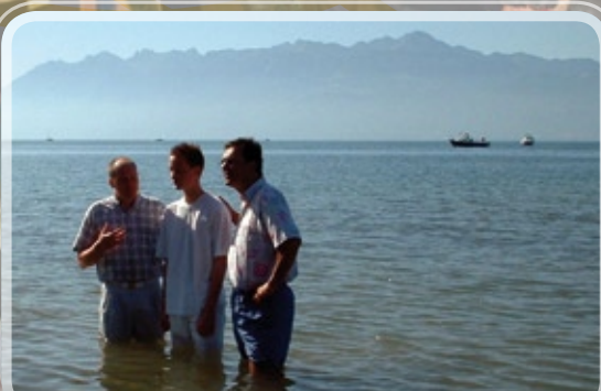
Baptêmes par Mike Delville et Paul Schoop