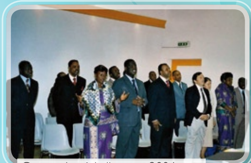
Convention à la ligue en 2004