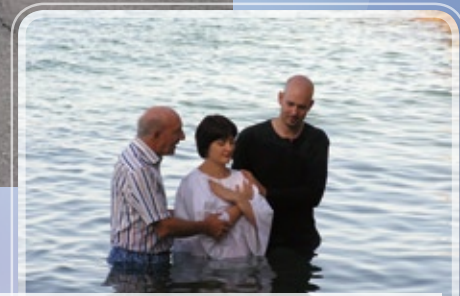
Baptême à la plage de la Grotte, Corseaux