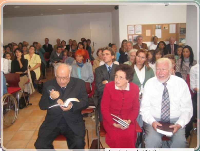
Auditoire de l'EER Locarno