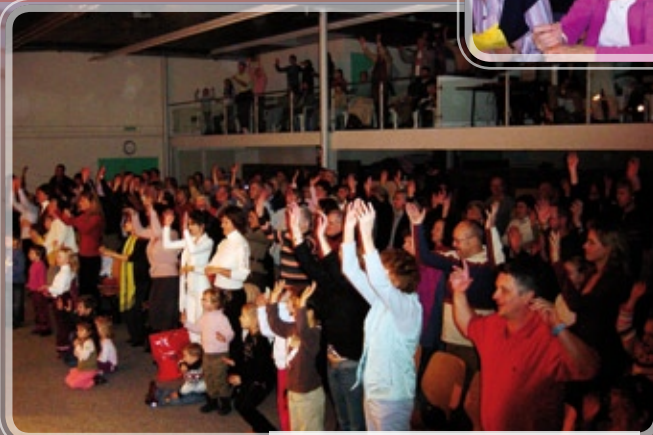
La salle polyvalente du Cèdre