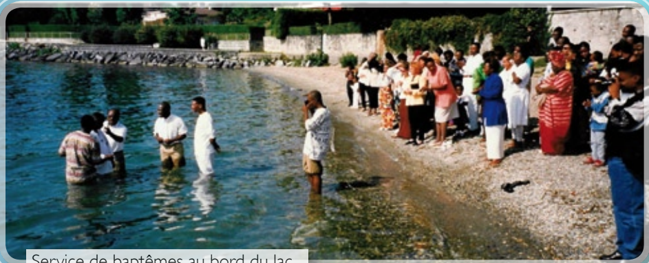
Service de baptêmes au bord du lac