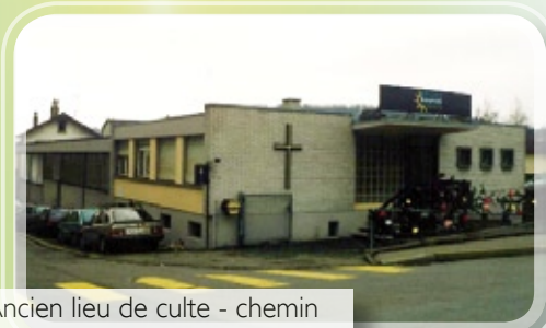
Ancien lieu de culte - chemin des Bâches