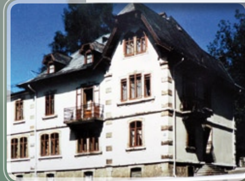
Le bâtiment de la rue du nord