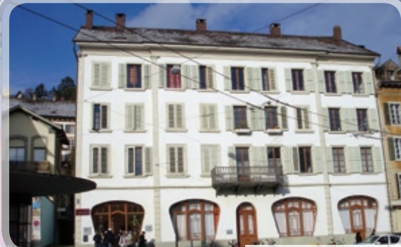
Le lieu de culte actuel