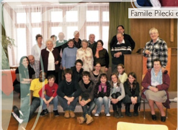
Jeunes et moins jeunes ensemble...