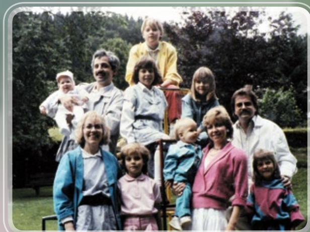
Familles Fontaine et Cino (Jude 25)