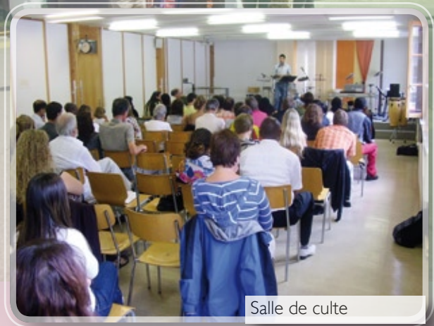
Salle de culte