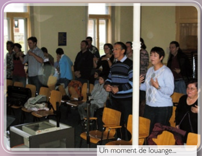
Un moment de louange...