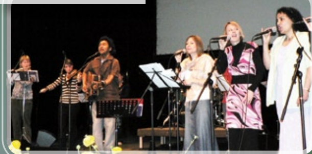
Le groupe de louange