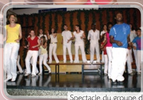
Spectacle du groupe de jeunes