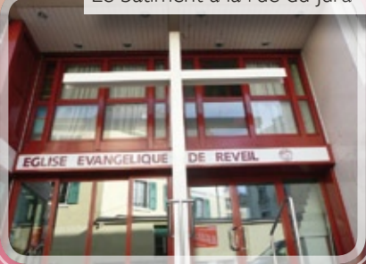
Le bâtiment à la rue du Jura 4