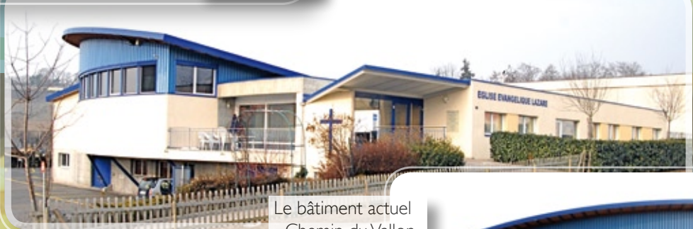
Le bâtiment actuel - Chemin du Vallon