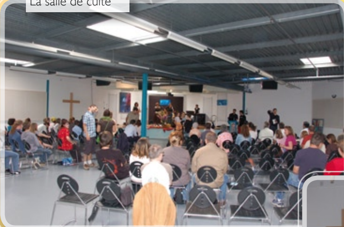
La salle de culte