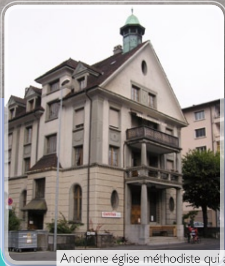
Ancienne église méthodiste qui a servi de lieu de rassemblement pendant des années