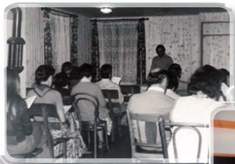
Culte à Saxon, dans le CEV