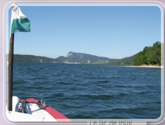
Le lac de joux