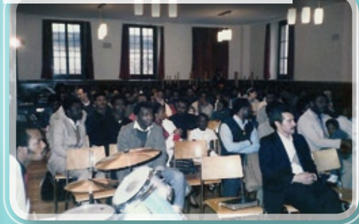
Culte à la salle Bridel en 1986