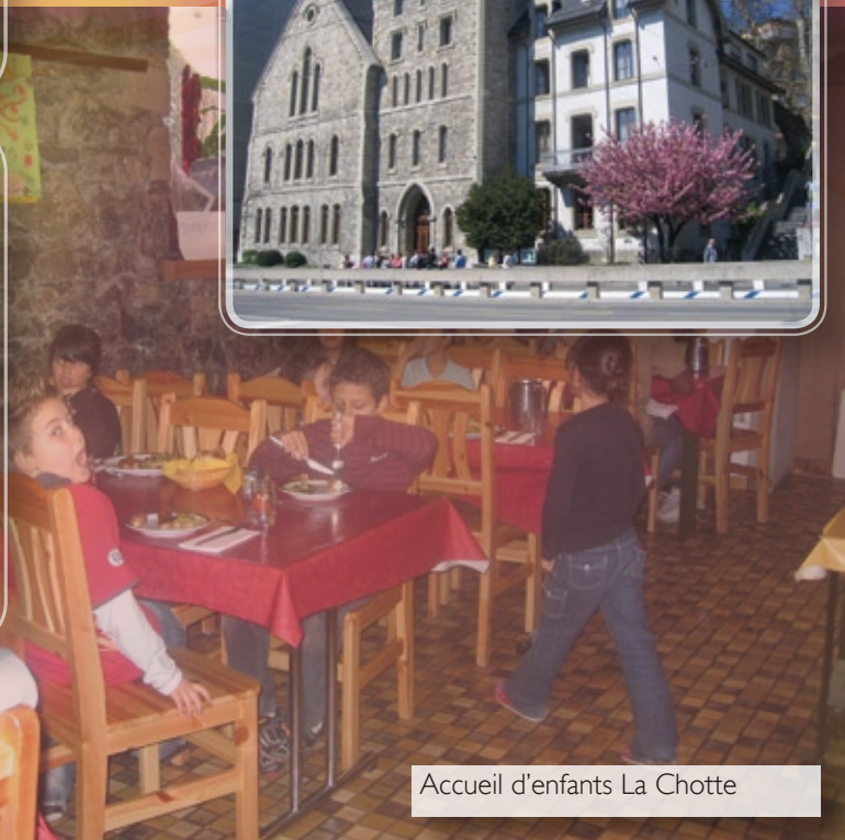
Accueil d'enfants La Chotte