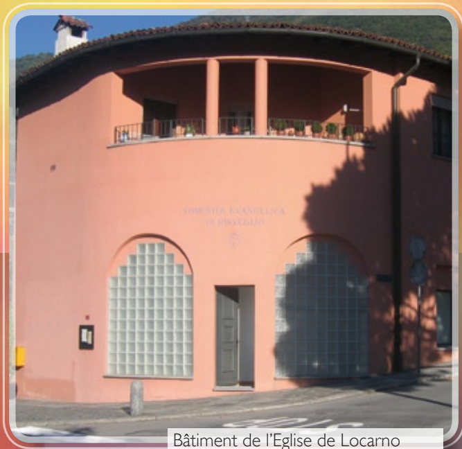
Bâtiment de l'Eglise de Locarno