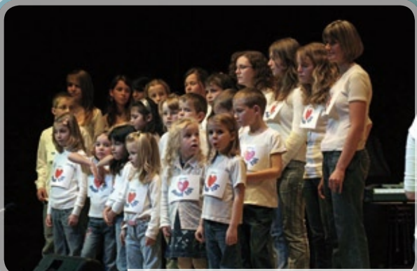
Une nouvelle génération se lève...