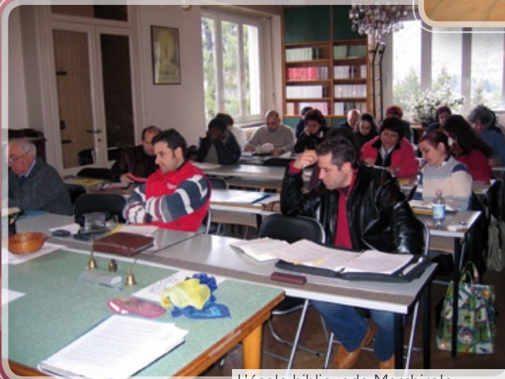
L'école biblique de Marchirolo