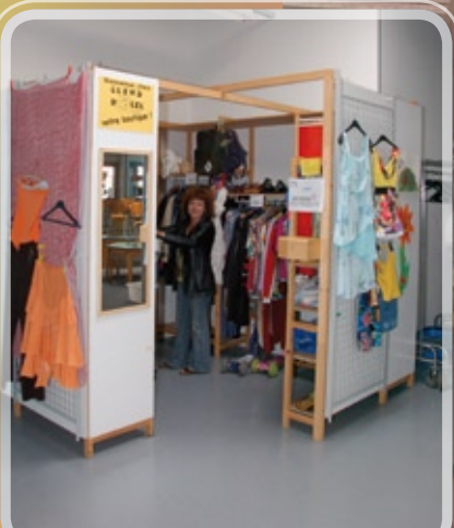
La boutique de seconde main «clin d'oeil»