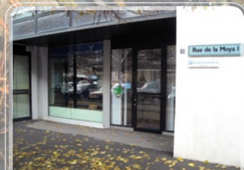
L'entrée du lieu de culte à Martigny