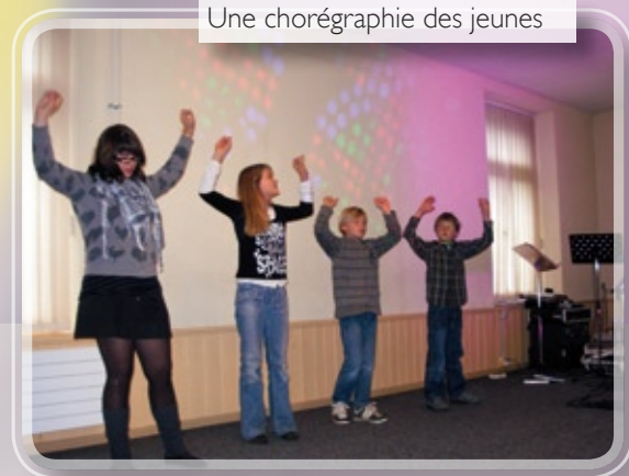
Une chorégraphie des jeunes