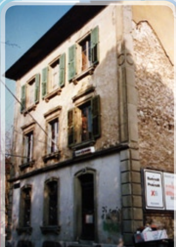
L'un des derniers lieux de rencontre du groupe de jeunes inter églises les « J'y Crois » à la rue du Marché Neuf avant la destruction du bâtiment.