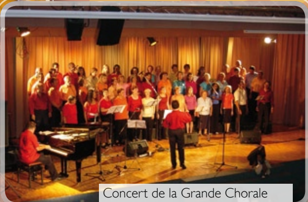
Concert de la Grande Chorale inter-églises de Nyon