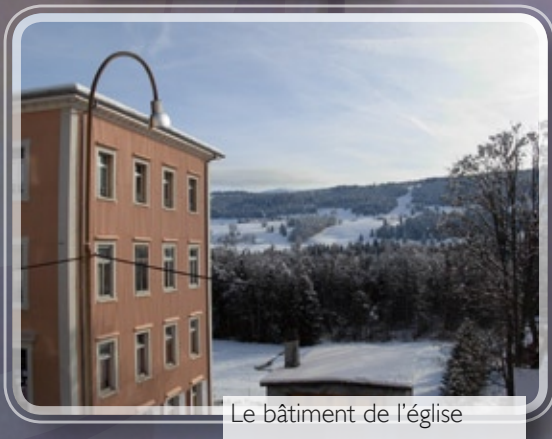
Le bâtiment de l'église