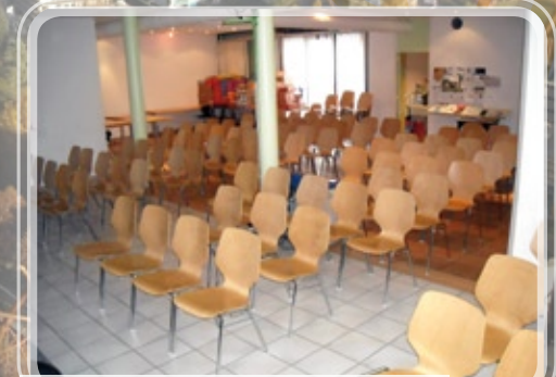
Salle de culte, achetée en 1996